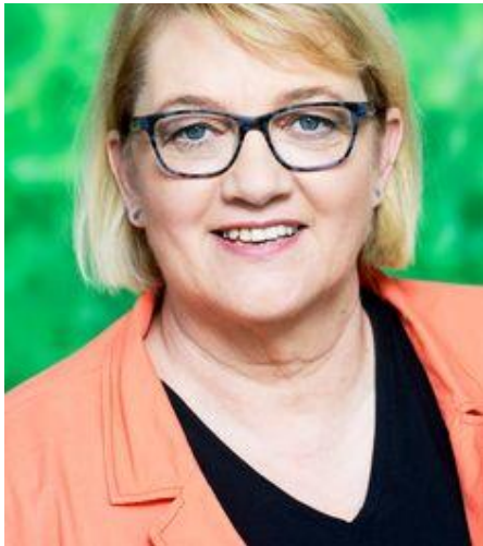
Kordula Schulz-Asche, MdB